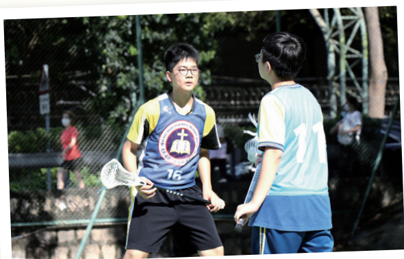
相信自己 堅持到底