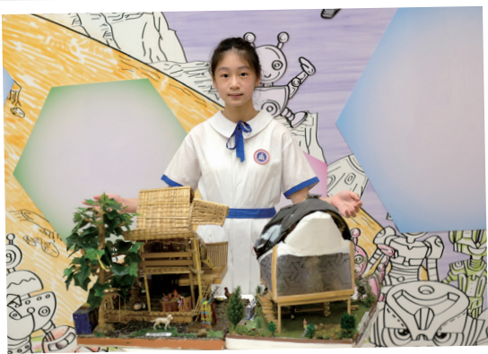
環保建築 由我做起

爸爸拖着我的小手，和我步入校園，彷彿就如昨天的事。記得剛進小學的時候，我還是一個膽怯的孩子。上課時，我靜靜的不敢發言，有問題不敢提問；下課了，我默默地坐在一旁，不敢和老師同學說話。幸好老師們的關愛，就如和暖的陽光照耀著我這棵幼苗。上課時，老師們鼓勵我發言提問，使我在學習上得到優良成績；課後時，老師們推動我積極參與活動，總樂於對我給予肯定和表揚，使我過去六年獲獎無數。