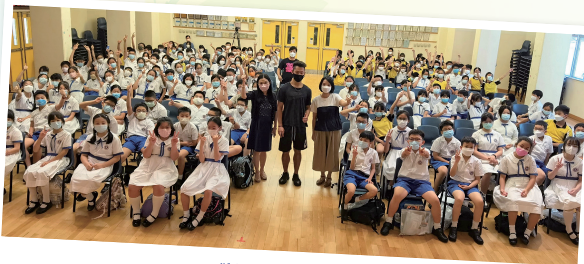
與師弟妹分享交流