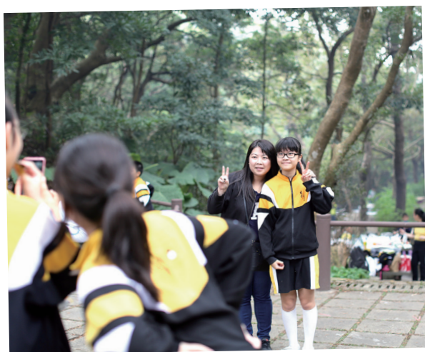
就是她讓我明白 Practice Makes Perfect

但是我很幸運，良師們及時向我伸出援手，把我從沼澤拉了出來。英文老師們不但沒有放棄我，更在學習上提供很多有用的建議。老師買補充練習給我，告訴我“Practice Makes Perfect”，鼓勵我多練多說英文，他們甚至利用早會前的時間幫我補習英文，解釋到我明白為止；又教會我「聽歌學英文」的學習方式，讓學習變得更有趣。學校也有開辦「英文提升班」，老師用更簡易的方式講解，幫助我理解英文的文法和詞彙；開辦的功課輔導班「卓越加油站」讓我可以立即解開功課疑惑，提升學習效率。那段期間學到的不只是英文知識，還有更重要的學習態度和方法，這些學習技巧讓我帶到中學和大學中實踐，實在獲益良多。現在每當我想放棄時，我都會回憶起這段經歷，告訴自己要努力與堅持，才不會辜負學校和老師的用心。