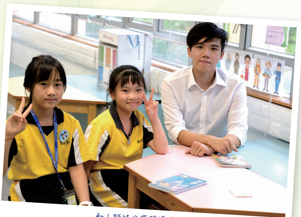
和小师妹分享閱讀的樂趣