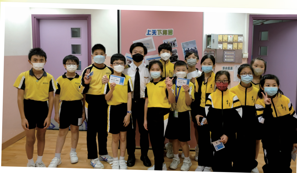
師兄來了，為你們打氣

day, however small. Don't make excuses. It's about perfecting the "you", not just doing more, not just being better but finding your best.