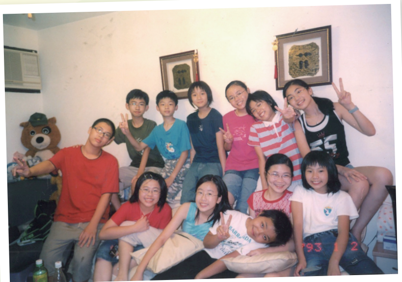
校園內外，我們都是如此友好

失敗不可怕，可怕的是在失敗後選擇了放棄。正如聖經中腓立比書第三章所記載：「弟兄們，我不是以為自己已經得著了，我只有一件事，就是忘記背後，努力面前的，向著標竿直跑，要得神在基督耶穌裡從上面召我來得的獎賞。」只要不放棄和認清自己的目標，你肯定可以活出豐盛的人生。