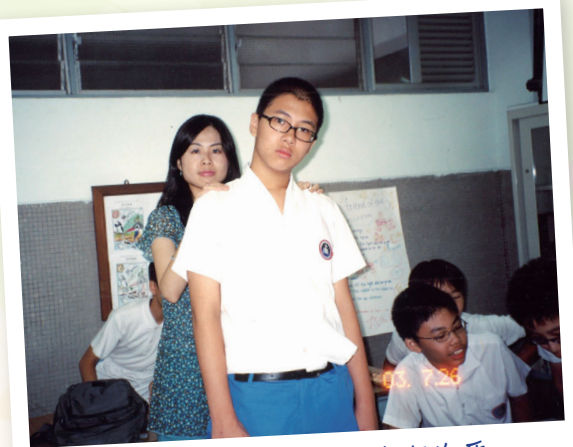
高大的我，仍需有你作後盾

博士畢業後，我加入了一間生物科技公司工作，主要從事研究和日常營運管理的職務。起初，我犯了很多剛進入職場的人都會犯的錯誤：認為自己既然博士畢業，什麼知識都已經掌握，就不再願意學習新知識和技能。直到一天，公司給我的項目因為管理不善而出現虧損，那時我才明白知識和技能是無盡的。所謂「學無止境」，無論你原本的學歷有多高，對一方面的專業理解有多