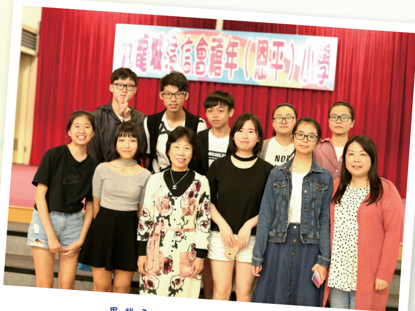
畢業了，師生情卻忘不了

這八年來，每當我回到母校，老師們無論多忙仍會抽時間與我聊天，甚至在學業及人生道路上給予我支持與力量，讓我倍感溫暖。很感激能夠成為禧年（恩平）的一份子，並且在如此美好的環境下長大，也感謝母校的栽培，讓我裝備得更好，樂觀對待挫折，勇敢追求所想，積極面對未來。