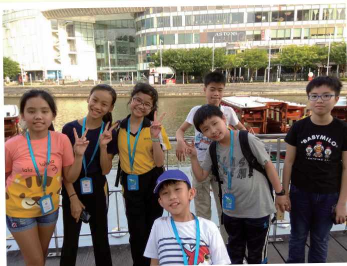
海外交流團，開闊我們的眼界

最後，我想對所有的師弟、師妹們說：「不要害怕挑戰和失敗，只要勇敢地迎接和克服困難，我們就能夠實現自己的夢想和目標。也要記得努力學習，全面發展自己的才能和發揮潛力，讓自己變得更加優秀和自信。最重要的是還要關心和愛護自己，愛護尊重他人，自尊自重、自強不息，健康快樂地成長和生活。」希望我的分享能夠帶給大家努力不懈的信心。最後祝大家學習進步，健康快樂！