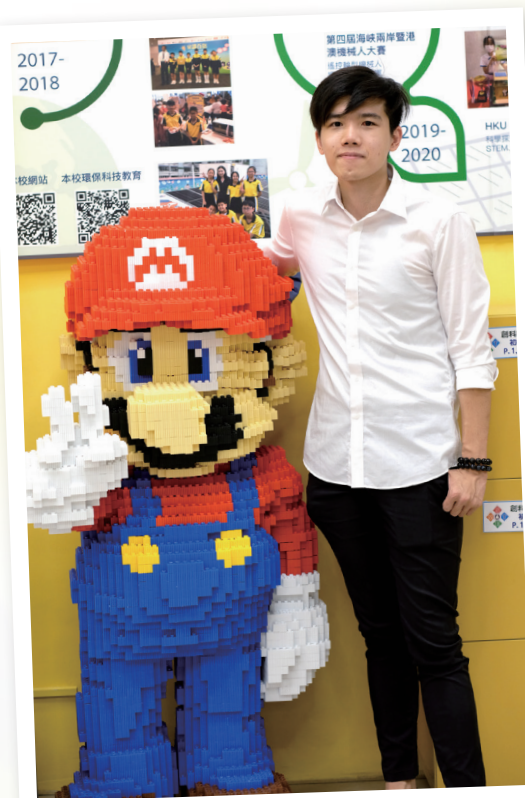
在禧年(恩平)小學可發揮無限創意