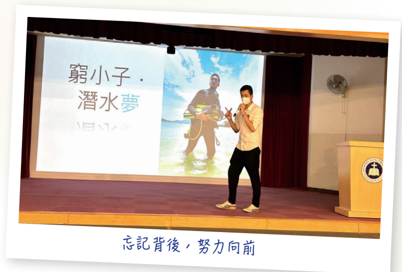
忘記背後，努力向前

跟自己對談過後，憶起自小喜歡大自然，嚮往自由自在，單純地希望將來會有一份能讓我四處遊歷的工作，既然生命是那麼無常與短暫，何不好好的活出自己？就是這麼一想，我開始尋覓一樣自己想去投入的事情，直至我遇上了潛水，我相信我找到了！