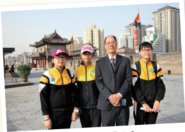
出走西安行了萬里路

母校為了開闊同學的眼界，提供了許多的資源，策劃不同的課外學習機會，讓同學能有機會更上一層樓，看到世界的光景，而我們要做的就是把握好並不浪費每一次機會，勇於踏出舒適圈，去嘗試新事物，學習書本以外的知識。