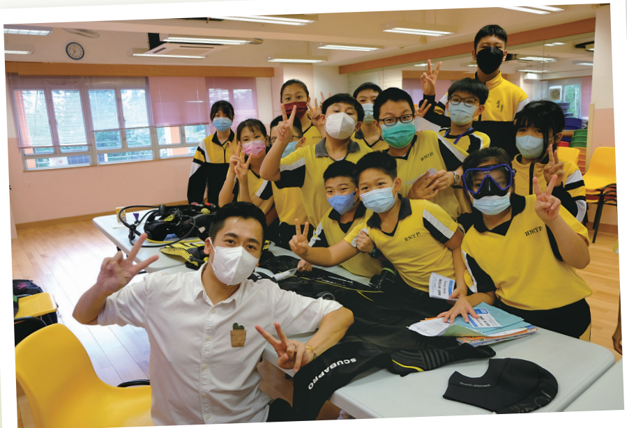
與師弟妹輕鬆分享工作上的趣事

現在，我很喜歡喝咖啡，咖啡豆經過高溫烘焙，磨碎成粉，再用接近一百度的熱水濾過，從中萃取獨特的風味。人生，難道不就是這樣嗎？經過磨鍊，得以昇華，呷一口苦中帶甘的黑咖啡，回味著辛酸過後的甜美，這，是人生！