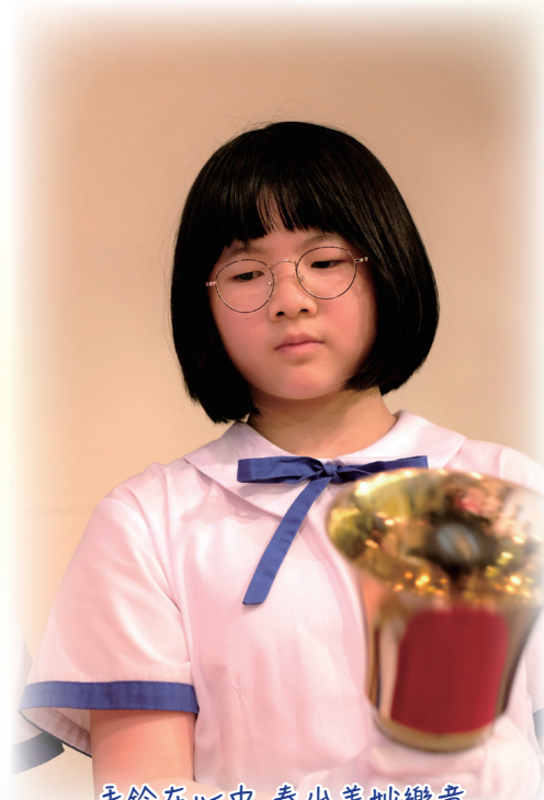
手鈴在心中 奏出美妙樂章

雖然我在音樂上看似一帆風順，但我在學術方面也曾經遇到一些困難。五年級時，我在數學方面真的很吃力，這讓我很緊張，擔心呈分試的成績會影響我的中學派位。但是，在老師的幫助下，我改變了學習態度，提高了學習效率和成績。因此，在呈分試考試中，我取得了理想的成績，更在中學自行分配學位階段已獲取錄。從那時起，我真正體會到學習永遠是一個不斷進步的過程。