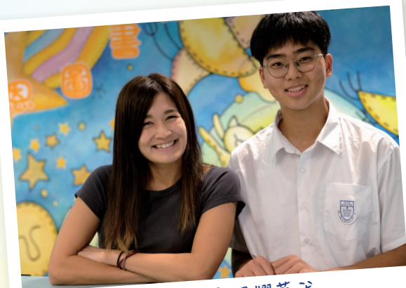
就是這個笑容照耀著我

風吹動了層層樹梢，吹散了天上的雲，吹起了時間的書本，翻了翻，定格在那天。老師站在電腦桌旁，手持著數張帶著學生們夢想的中學錄取通知書，看著眼前的同學一個個拿著它，跳起來歡呼，我心如鹿撞，心裡七上八下，如激蕩的湖水一樣不能平靜，手心時不時地滲透著冷汗。「沒事，老師們會幫你的！」老師嘴裡安慰道，並把裝著夢想的通知書遞給我，可換來的卻是無盡的失落，望著手中的錄取通知書，我慢慢地回到座位上，目光呆滯地瞪著紙上那間不曾心儀的中學，仿佛那些數不盡的複習資料，那些書本上的數不盡知識點，那位在數不盡的半夜，仍舊爬起來溫書的少年，都化為虛無縹緲……想到這，不禁頓時覺得喉嚨哽咽，嘴角不由自主地抽搐了幾下，眼眶漸漸濕潤起來。同學們回頭看著我，一個個走過來用雙手拍了拍我的肩膀，說道：「別氣餒，振作起來！」「你再去學校面試看看，一定可以成功的！」我抬起頭，睜開紅腫的眼睛，看著他們，心裡暗自下定決心，一定不能讓他們失望。這時老師拿著一疊資料告訴我：「我已經準備好你心儀的兩間中學的入學申請表了，我們再試試！」過後，老師們犧牲自己的休息時間，來為我練習面試，指點我面試的注意事項，不斷鼓勵和安慰我，這一刻，仿佛在萬丈深淵中出現了點點星光。