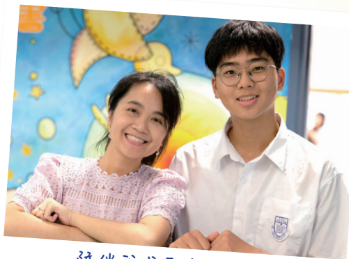
陪伴我成長的良師

輪到我面試了，我拿起背包向面試室走去，卻發現背包變得十分沉重，打開一看，原來裡面裝滿了同學的祝福，老師的期望，家長的希望和我的夢想，背著它們，走到面試室門口，這一路上不停地在心裡為自己加油打氣，直到踏入那道的門，背包化成翅膀，助我翱翔，飛往夢想。