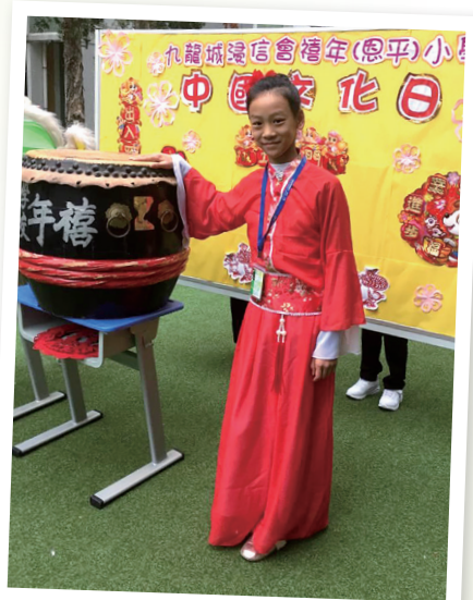
多姿多彩的校園生活

除了以上的分享，我還想鼓勵你們盡可能參加體育活動。不要小看體育活動的好處，當我們學習到疲倦的時候，我們其實可以通過做運動鍛鍊身體，改善疲憊不堪的精神狀態。何主任就經常帶著我們去參加學校聯賽活動。有了何主任的專業指導，我從當時弱不禁風到飛奔跑道，在得到榮譽的同時我也強大了自我。俗話說：「身體是革命的本錢」，只有通過不懈努力鍛鍊身體，我們才有能力和信心用堅強的體魄迎接學習和生活上的所有困難。