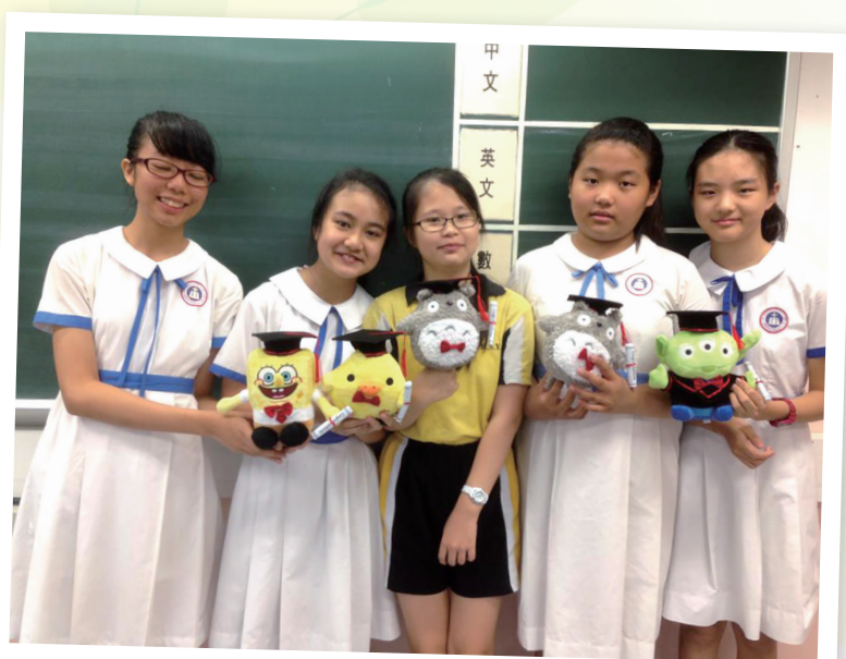
同學們的同行，使我變得更堅壯

前些年，我獲中大中文系錄取，我無比興奮。中文是我的強項，也是我一直以來的興趣，能夠被心儀的學校及專業錄取是一件十分幸運的事。相信若沒有當年呈分試的努力，或許也不會有今日的我。而我也十分感恩自己加入了禧恩這個溫暖的大家庭，有和藹可親的校長、循循善誘的老師、溫馨的校園環境讓我在這裡感受到了家的溫暖，最終才能茁壯地成長。作為師姐，我想用一句名言勉勵各位師弟师妹：「世上無難事，只怕有心人。」求學的路上，我們總會遇到困難，沒有可能一帆風順，但只要我們下定決心去克服困難，凡事都有可能迎刃而解。希望大家能夠珍惜在禧恩的每一天，將來有朝一日學有所成，能夠不忘師恩，回饋母校。