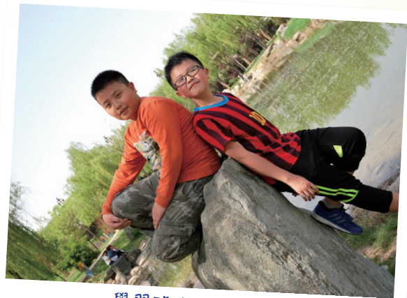
學習路上 從不孤單

大家的第一志願會排什麼呢？當年我十分順利地入讀了我第一志願的中學。當時「入大學」「做社工」這兩個人生目標並不是在我的人生規劃內。是什麼讓我突然間脫胎換骨呢？我想是因為當時我遇見了自己鍾愛的科目——中國歷史科。在中一考試時，我的中史科成績竟然可以有80多分。那一刻成功的感覺，正正就是推動我前行的力量，令我知道自己其實是有能力學習的。自此，我深刻地記住這種成功的感覺，在其他科目不斷上進，嘗試挑戰自己極限。只要你找到屬於自己的位置，發現到自己的能力，便可以發光發亮，成就更多。