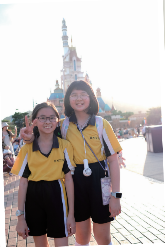
禧恩天空下，我和妹妹快樂成長

回想這六年，我的故事訴說著一個膽怯、不自信的小學生，如何轉變為一個有自信、有能力的人。感謝禧年（恩平）小學，使我每天總掛上天真爛漫的笑容，在這充滿愛和慈悲的環境中快樂成長。