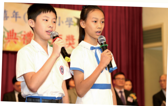
畢業禮上為學生獻唱

要性。這些活動讓我學會了很多技能和知識，也培養了自信和面對挑戰的勇氣。我相信只要我堅持努力，我一定能夠達到我的目標。