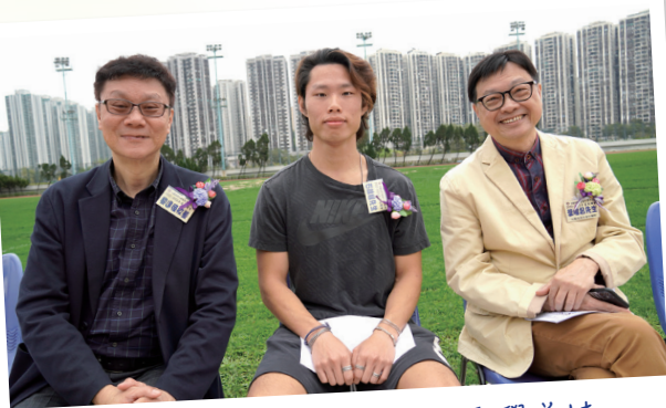
在運動會擔任主禮嘉賓，勉勵學弟妹

起初，成立田徑隊並不容易，我們只有寥寥數人參加訓練。但是，我們堅持不懈，和夥伴一起奮鬥，彼此真誠相待，感恩擁有彼此，漸漸更多同學加入田徑隊，一起追求更多、一起步向更遠，最終我們都取得了不錯的成績。這個過程讓我明白到，只要持之以恆，