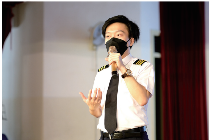
返回母校，踏上講台，分享職業生涯

What I learned in primary school shaped who I am. From my brief six years in primary school, I realized what makes life valuable is that it DOESN'T LAST FOREVER. What makes it precious is that it ENDS. So, live a life that matters to you. Fight for what you care about. Because even if you fall short, what better keys is there to live? Keep your determination and hard work ongoing, because they're key to success. Thousands of people say they want success but never take action. To succeed, you must want it as desperately as you want air to breathe. Forget everything else. When you reach that level of determination, you will succeed. It's a lifelong journey of constant learning and improvement. Make progress each