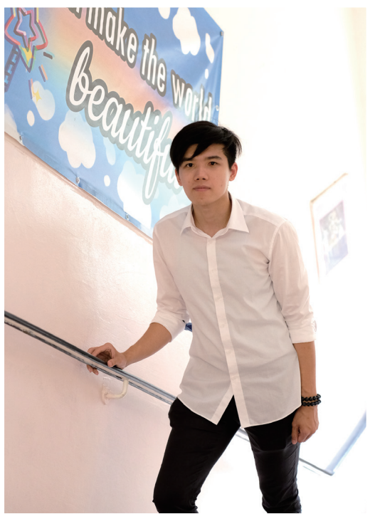
回到校園感受到學校創設更美好的學習環境

也要感謝那些為我們付出過的老師。正是他們的辛勤工作和付出，才能讓現在的我能夠回饋社會。