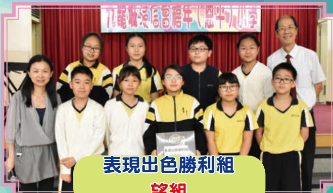
表現出色勝利組 望組