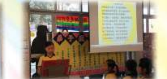
我是六年級唯一的伴奏師