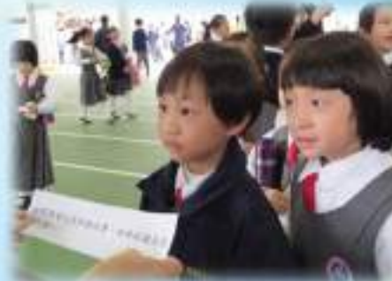
一年級學生進行金句背誦比賽