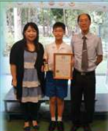
Inter-School Writing Competition - Most Creative Awards (Bronze)

We hope all our students learn English both inside and outside school. Online reading programme, 'Bug Club' has been promoted. Fiction and non-fiction readers are chosen for students. They enjoy reading stories and listening to the audio of the books. Their reading ability is gradually enhanced.