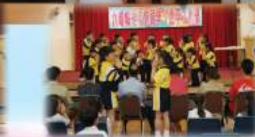
我們1C班有專業指揮員