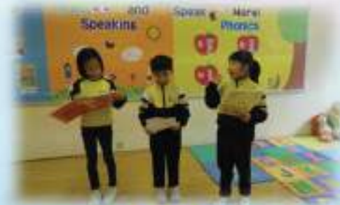
English Drama Group