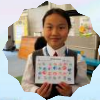
領袖小天使擔任攤位主持