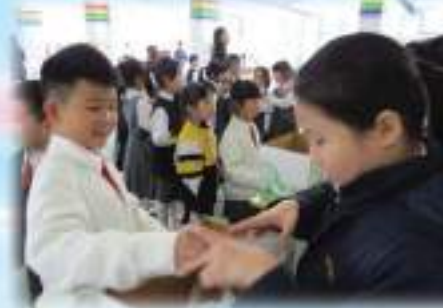
學生十分投入參與聖經金句背誦比賽