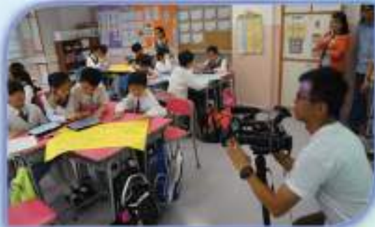
電子學習支援科學科自主學習計劃