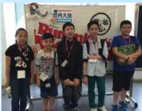
第九屆魔力橋(香港區選拔賽)