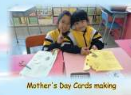
Mother's Day Cards making