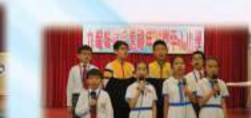
五年級團契好激烈