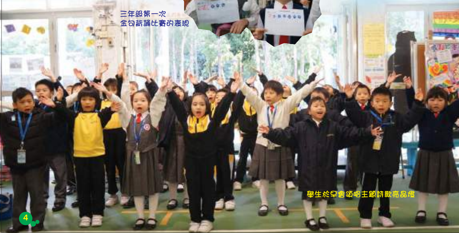
學生於早會頌唱主題詩歌亮晶燈