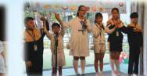
我們的比賽歌曲是活著就是祭