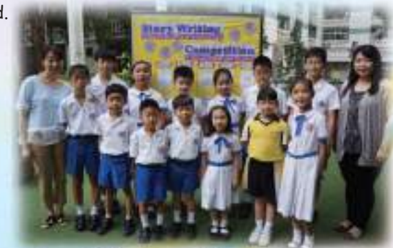
Story Writing Competition