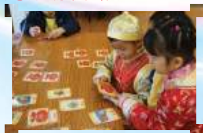
中國文化嘉年華-攤位遊戲