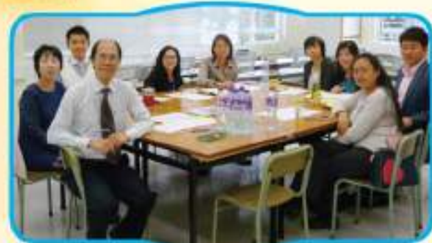
二零一四至二零一五年度家長教師會財政收支報告(截至15/06/2015)