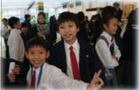
五年級參與金句背誦比賽的情況