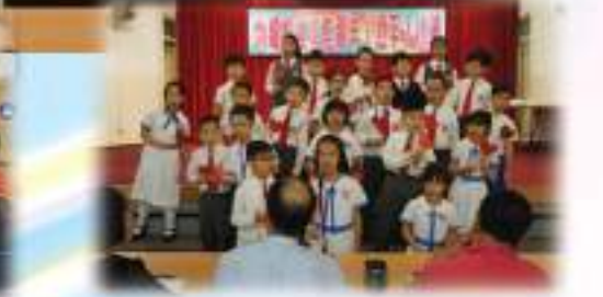
3B班是一群充滿愛的小天使