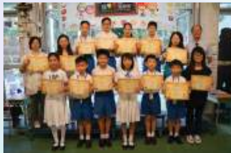
教師學生書寫技能網絡測評