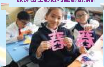
中國文化嘉年華-剪紙