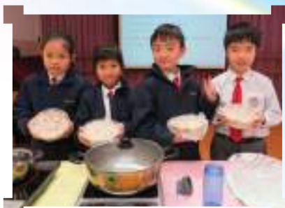
中國文化嘉年華-製作蘿蔔糕