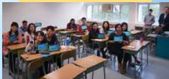
分享會-利用平板電腦教學