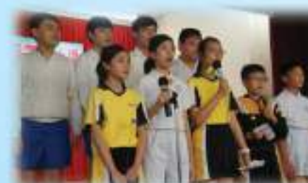
我們感動了不少評判