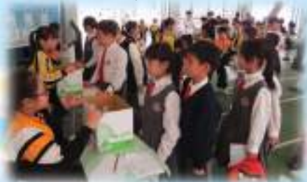
六年級參與金句背誦比賽的情況