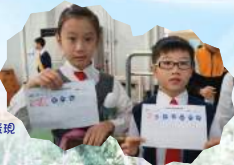
三年級第一次金句背誦比賽的表現