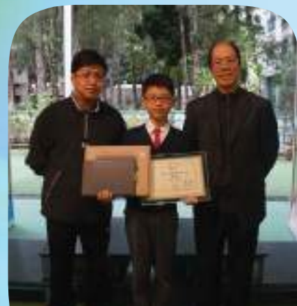
漫畫星光校際繪圖板寫生比賽 -小學組冠軍

而本校亦透過創建縱橫輸入法的周宗繼先生及本校校董的鼎力支持下，本校電腦室及禮堂等電腦設備亦已煥然一新，為學生提供一個舒適及高速的網絡環境下進行學習。