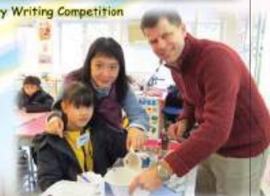
PLP-R/W Lessons Fun