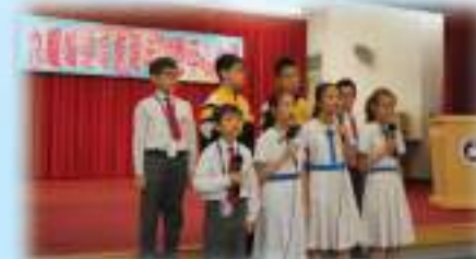
我們一點也不怯場