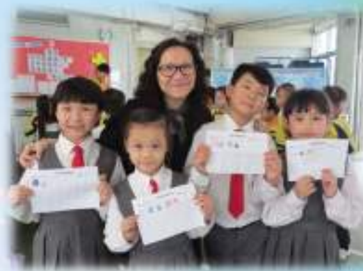
我們都能背誦不少金句呀!

其中「齊來sing sing sing」歌唱比賽更是全校性參與的比賽，同學自行揀選詩歌去參賽，大家都十分投入，反應熱烈。