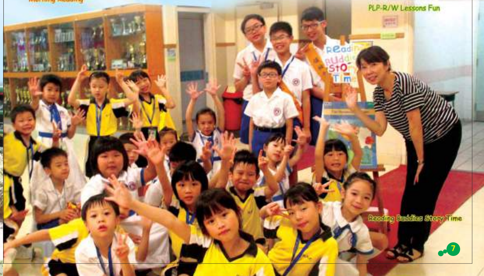
Reading Buddies Story Time