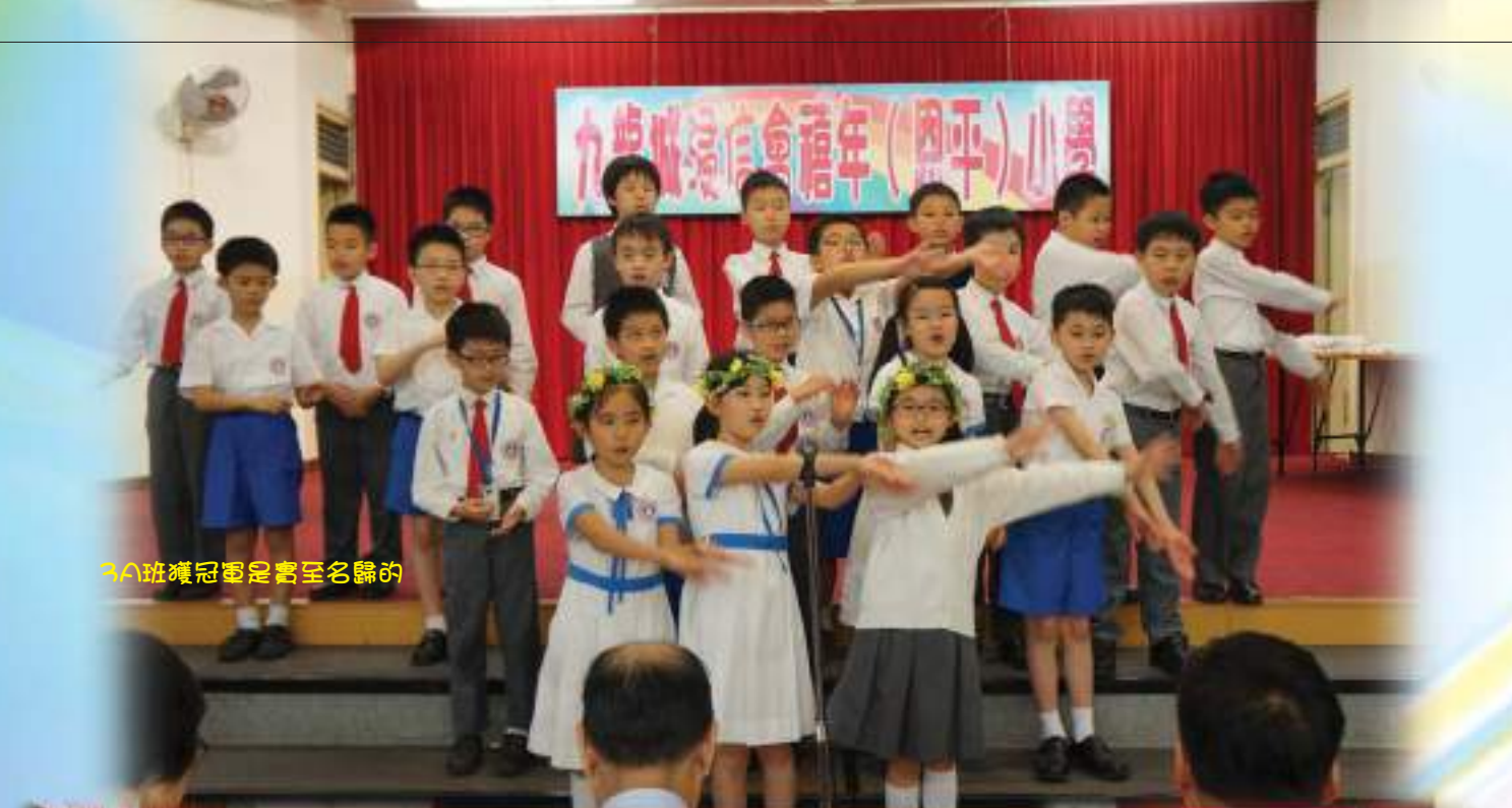
3A班獲冠軍是實至名歸的