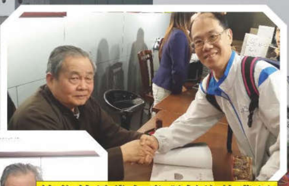
這位就是當年發現俑坑的農民