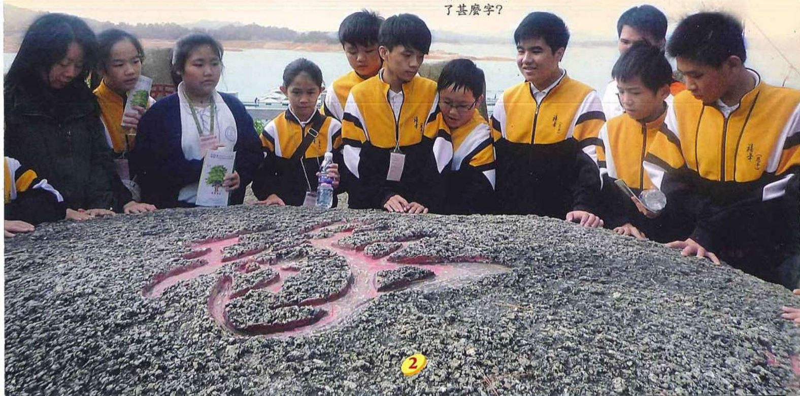
猜猜石上刻了甚麼字?