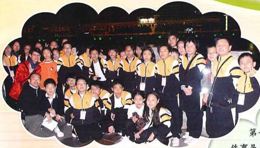
數碼燈柱前大合照