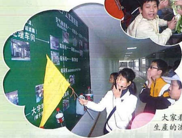
大家看看生產的流程圖