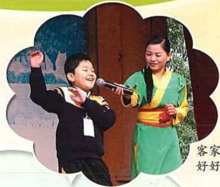
客家歌舞 好好聽呢!

第一天我們到了河源的時候，第一件事是去吃午飯，我覺得那些餸菜不太好，那口香雞無論我怎樣咬，都吞不下。之後我們去了遊覽鏡花緣和參觀萬綠湖，我真的覺得很奇怪，為什麼那些湖水會是那麼碧綠的，我已問過導遊了，但是都不太明白。我們還欣賞了客家歌舞表演，我們當中的一個同學還被邀上台表演呢！